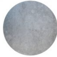
Kuuma- sinkitty pinta