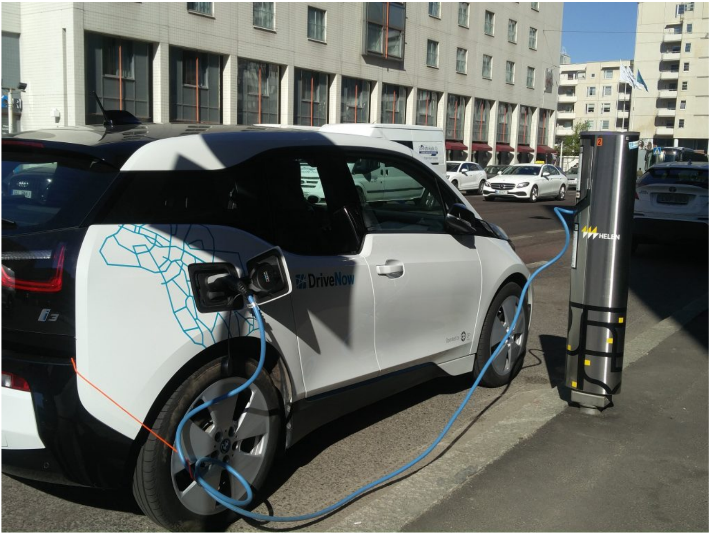
Sähköauton latauspiste Kampissa.