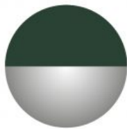
RAL 6012, Ruostumaton teräs