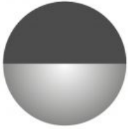
RAL 7021, Ruostumaton teräs